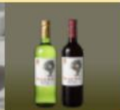
【ワイン】 ワインキュレーション

■ 「ヒマラヤ株主プレミアムメンバーズ」の優待制度を利用するには、ヒマラヤメンバーズ登録後に株主番号を連携するだけ！既にヒマラヤメンバーズ会員の方は、お持ちのアカウントをそのままお使いいただけます。