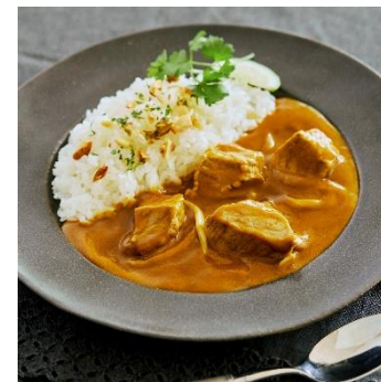
【養老ミート】 お肉ごろごろビーフ カレー 1,500pt