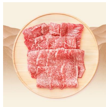
【養老ミート】 飛騨牛焼肉セット 2人前 4,000pt