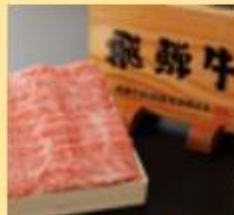
【飛騨牛】 養老ミート