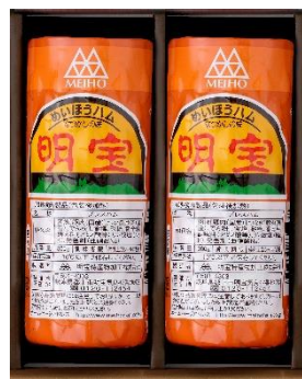
【明宝ハム】 明宝ハム2本入り