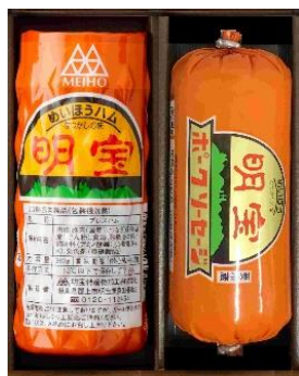
【明宝ハム】 明宝ハムとポーク ソーセージ詰合せ