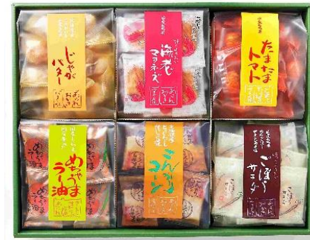
【森白製菓】 おかき道楽 (L) 6袋 3,000pt